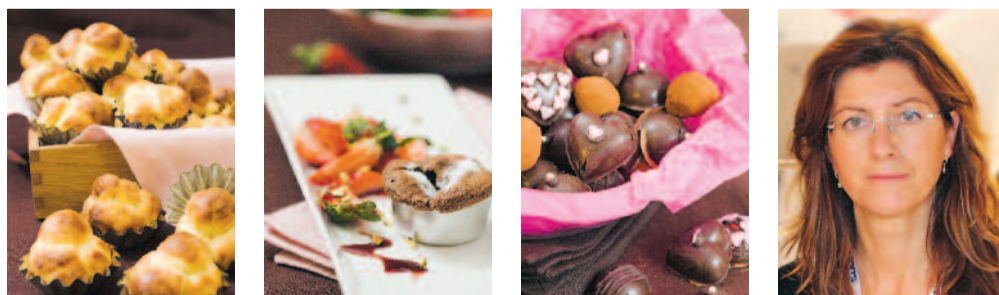
Examensarbete fotograferat av Milena S Grandi, Marknadskommunikatör på Servera - "Choklad".

” Professionell Fotograf var en riktig höjdpunkt. Tack vare kursen kan jag nu fota manuellt. Jag kan hantera både tekniken och kompositionen av bilderna, det är guld värt! Jag rekommenderar den här utbildningen för den som är intresserad av att antingen lära sig fota utan någon som helst tidigare erfarenhet, men även för den som vill fördjupa sig i ämnet och friska upp sina kunskaper.”