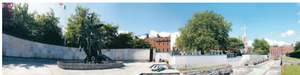
Examensarbete "Panorama Garden of remembrance" i Dublin.